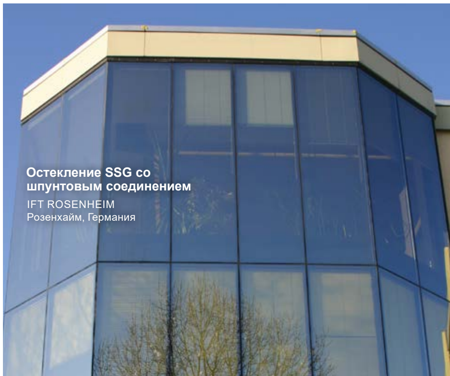
Остекление SSG со шпунтовым соединением IFT ROSENHEIM Розенхайм, Германия

25-летний герметик прошел испытания на соответствие ETAG 002-1 и теоретически подтвердил возможность эксплуатации в течение дополнительных 25 лет, что в сумме составляет 50 лет.