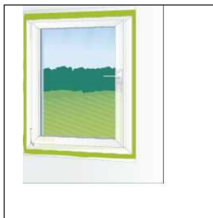
Для монтажа оконных и дверных коробок