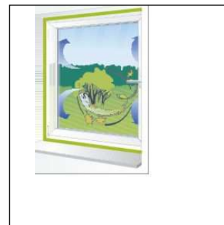
Качество соответствует требованиям системы i3